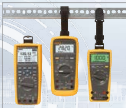
Fluke TPAK ToolPak™ magnetiskt fäste

Häng din mätare på olika sätt och håll händerna fria.