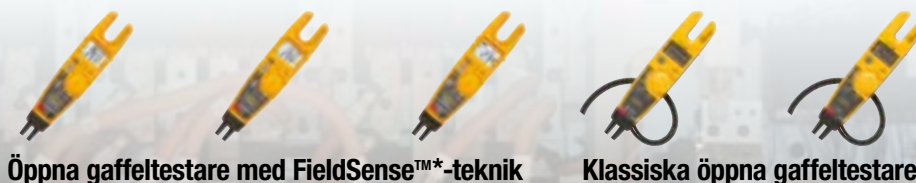
Öppna gaffeltestare med FieldSense™-teknik