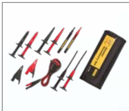
Fluke TLK-225 SureGrip™ proffstillbehörspaket

Proffstillbehörspaketet Fluke TLK-225 SureGrip™ är den perfekta ersättningssatsen som ger flexibilitet och komfort, med alla SureGrip™-kablar och prober i en praktisk påse med sex fickor och som går att rulla ihop, samt TL224-testkablar.