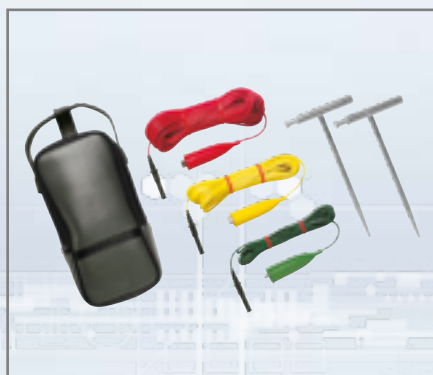
Fluke ES165X testsats med jordspikar

Setet tillåter enkel jordresistanstest med hjälp av treledarmetoden och hjälpjordspett.