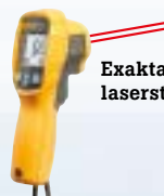
Exakta dubbla laserstrålar