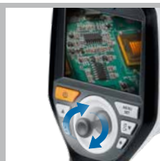
Manuell 3D kontroll