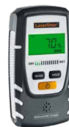
MoistureFinder Compact + batteri