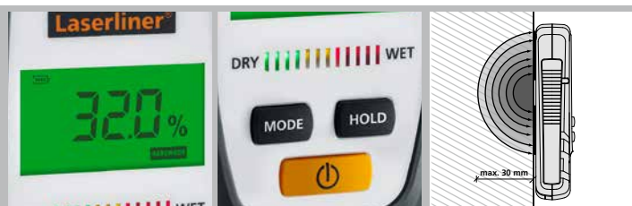
Stor översiktlig LC-display

MÅTT (B x H x Dj) 81 mm x 154 mm x 36 mm